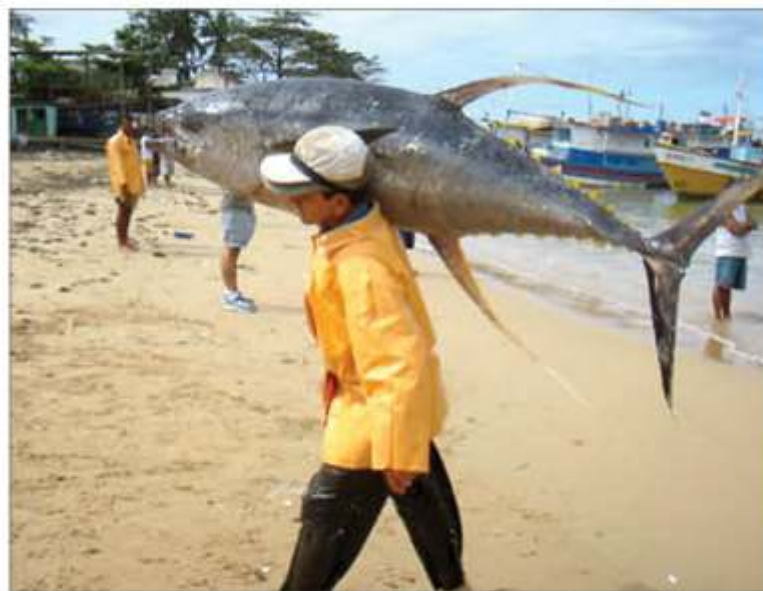
» Até ciganos receberam seguro-defeso, enquanto o pescador passa dias tão difíceis em alto mar

Perguntada se a colônia junta documentos de quem não pesca, ela se confunde: "é livre, tipo assim, se você quiser ir lá e fazer sua carteira, vai dar entrada com seus documentos que hoje qualquer pessoa pode fazer, até quem tem carteira assinada pode fazer a carteira de pescador,