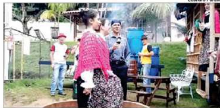
» A Festitália em Alfredo Chaves é um evento muito esperado e a carretela atrai milhares de pessoas

avenida a apresentação da 'vinhocicleta' e da 'polentopeia' - bicicletas que a cada edição do evento ganham espaços para mais um integrante -, galinheiro móvel e um caminhão adaptado que apresentará os principais utensílios e ferramentas utilizados pelos imigrantes, como a moenda de cana e o grupião, utilizada antigamente para serrar madeira".