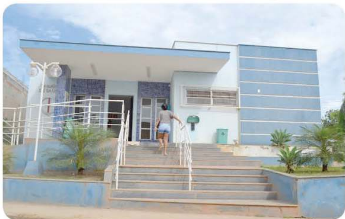
« A população ainda não tem atendimento odontológico no Posto de Santo Eduardo em Kennedy e falta fisioterapeutas

constam na lista de padronização REMUME, e a nossa é a maior lista de medicamentos do Estado com 389 itens, tendo somente a do Estado (SESA) maior com 417 itens. O que ocorre é que muitos pacientes que tem atendimento particular, fora do município, buscam os medicamentos na Rede e é impossível termos disponível 100% dos medicamentos do mercado na CAF (Central de Abastecimento farmacêutico), outro grande desafio é a opção pelo Genérico, pois existe orientação do Ministério da Saúde para optarmos pelos genéricos, mas muitos pacientes se negam a usar o genérico, mesmo ele sendo a cópia com exatidão do medicamento de marca e com a mesma ação. E estas situações levam a algumas dificuldades no atendimento de 100% da demanda, mas mesmo assim nos casos de medicamentos éticos, ou seja, não genéricos, temos utilizado a ata de