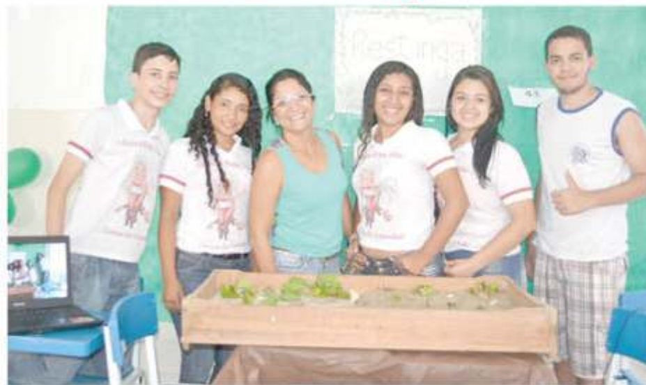
» Alunos do Filomena em aula de Língua Portuguesa

Como a escola cresce a cada ano, em 2014, pela primeira vez na história da EEEFM Profª Filomena Quitiba, tivemos uma disciplina na escala Proficiente, ou seja, a maioria (51,1%) dos alunos da 8ª série em 2014 sabia