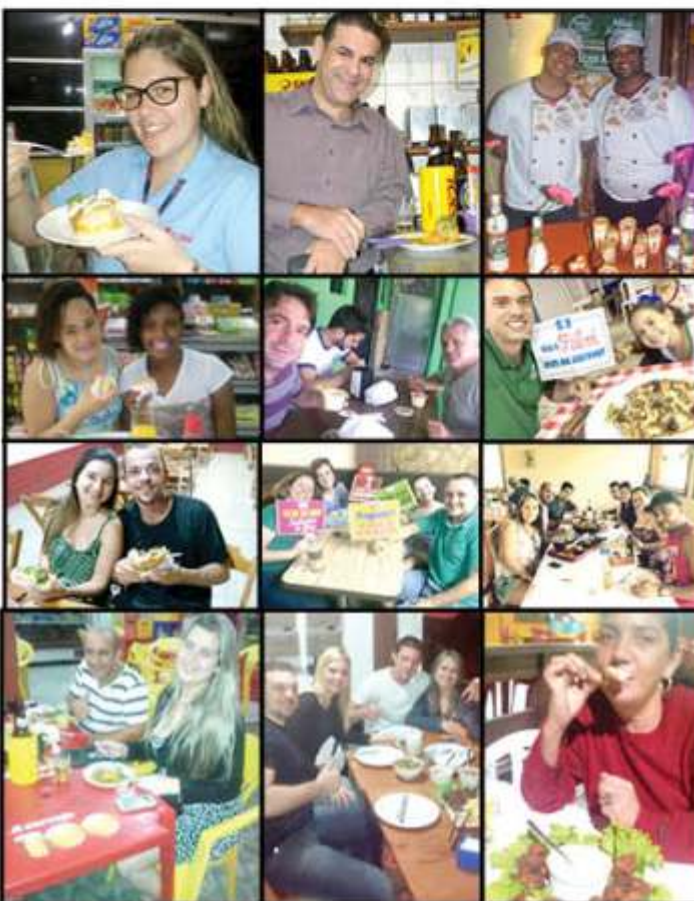
» Provando os pratos nos estabelecimentos que participam dos sabores