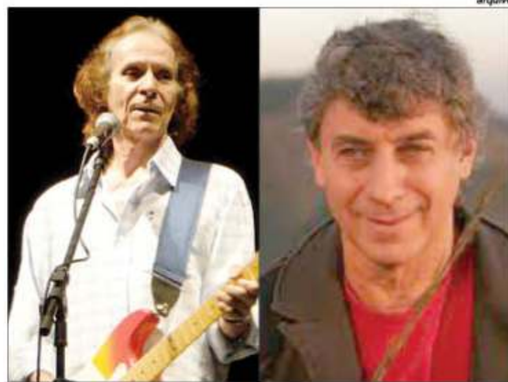
» O III Festival de Música de Itapemirim traz Beto Guedes e Flávio Venturini

O evento contará com apresentação de 20 músicas na sexta-feira (17), com início previsto para às 20h. Logo após, às 23h, haverá show nacional com o cantor Beto Guedes. Os sucessos "Quando te vi", "Sol de primavera" e "Amor de índio" serão lembrados durante seu belo espetáculo. No sábado (18), também às 20h, será realizada a apresentação das 10 finalistas e, em seguida, às 23h, o show