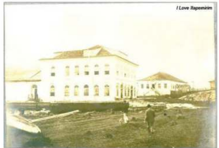
I Love Itapemirim

concretamente fica o ônus de não tê-lo feito e nada marcado na história. Finalmente, na nossa retina fatigada, dizemos: No meio do caminho tinha um belo Trapiche...Tinha um belo Trapiche no meio do caminho.