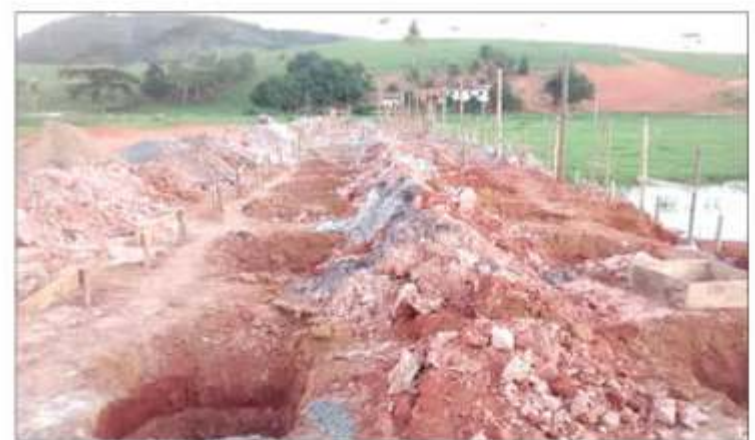
» Já começaram as obras para a construção do Clube do Cavalo em Iriri/Anchieta

A construção do Clube do Cavalo é uma realização da Prefeitura de Anchieta, por meio da secretaria de Infraestrutura. A sede