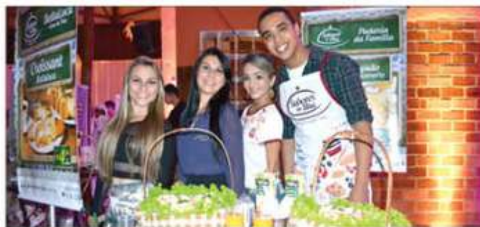
» A equipe da Padaria da Família reunida no lançamento do Sabores da Ilha

Isso é demais, vindo para Piúma não deixe de conhecer os estabelecimentos e experimentar as delícias. Todos os pratos são muito bem feitos e o atendimento nas casas é vip.