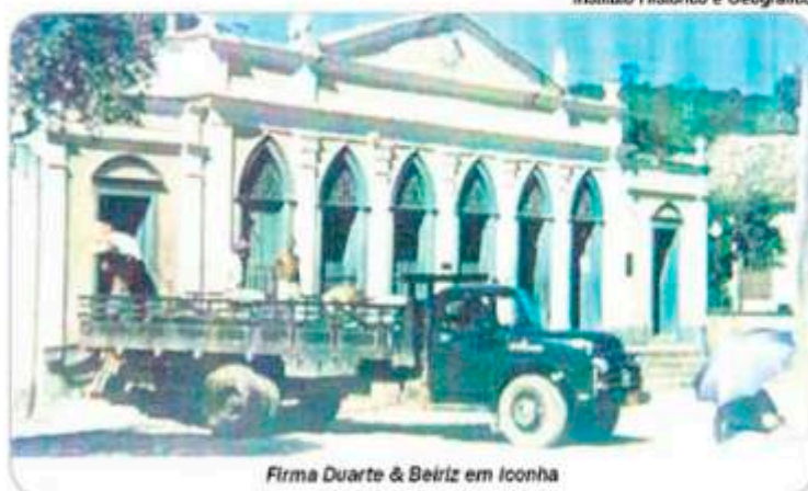
Firma Duarte & Beiriz em Iconha