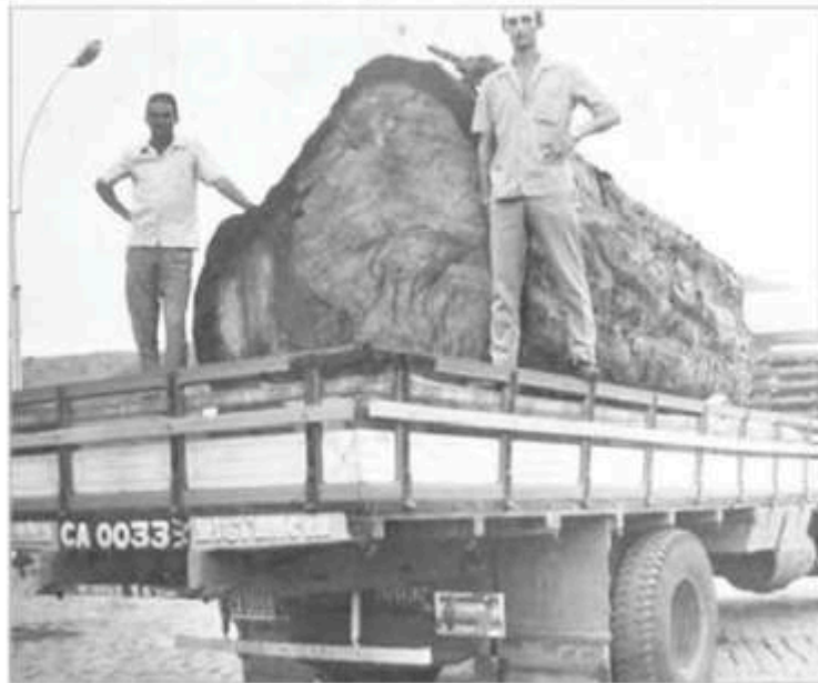
Os primeiros caminhoneiros de Iconha sofreram muito nas estradas de chão mas traziam para suas famílias o sustento da lida

Vallat frisou que muitas empresas passam de pais para filhos. Famílias inteiras trabalham nos negócios que hoje amarga com a crise, e as demissões assustam os empresários. "Tenho uns amigos que hoje são donos de casas de peças e postos de gasolina, eles que iniciaram esse trabalho no tempo da estrada de chão ainda e foi seguindo, de pai para filho. Hoje, os filhos não seguem esse destino mais, no entanto, acabou se tornando terra de caminhoneiros. Há 18 anos tivemos a ideia de