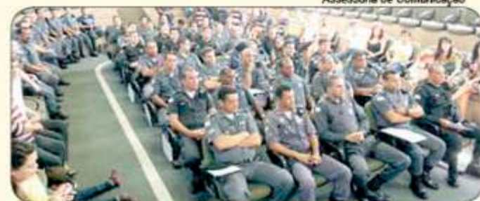
» Os policiais militares receberam homenagem pelo desempenho dos seus trabalhos

Policiais Militares de Anchieta, Piúma, Alfredo Chaves e Iconha, foram homenageados pelo desempenho em seus trabalhos e por serviços prestados à comunidade.