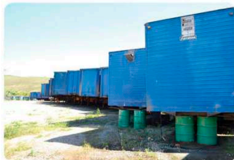
» A Transportadora Jolivan já demitiu mais de 150 motoristas e as carretas estão paradas no pátio