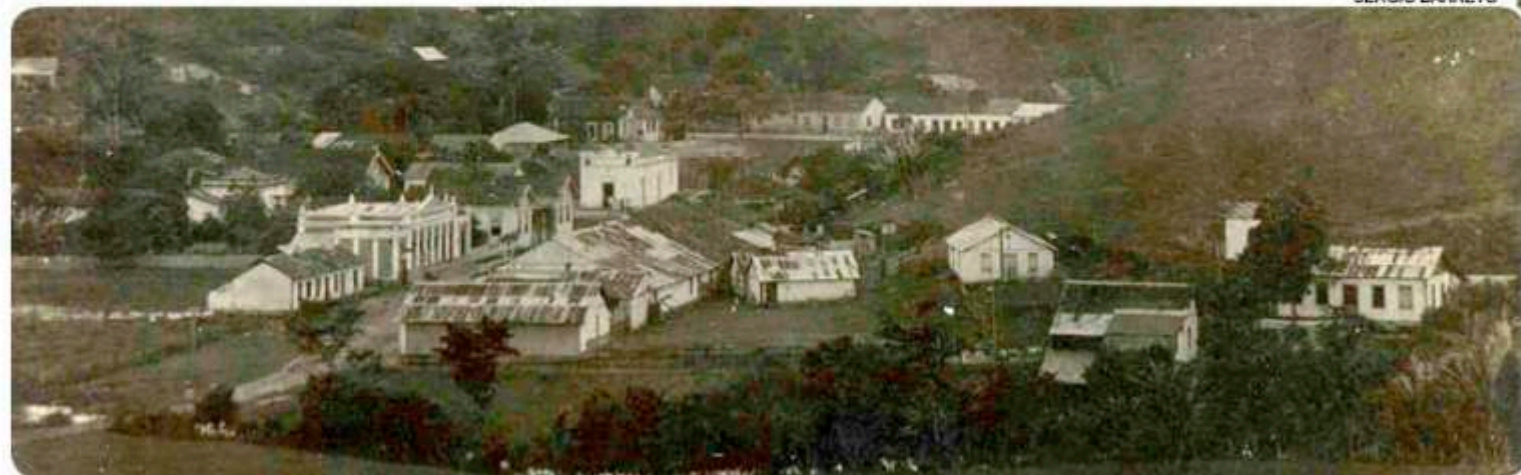
Iconha emancipou-se no dia 03 de julho de 1924, até então a sede era em Piúma