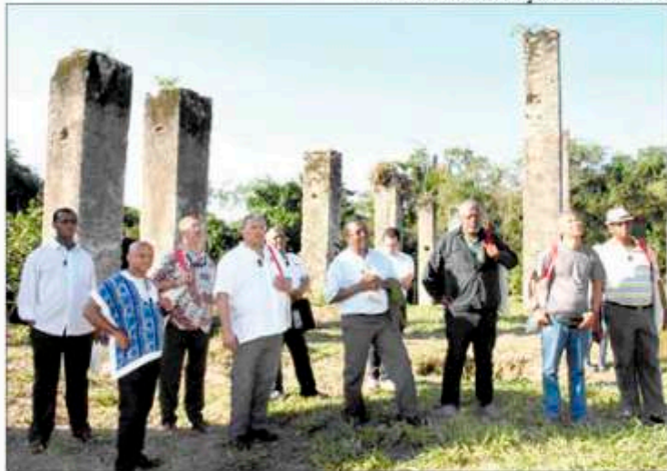
» O encontro do Movimento Negro do Brasil com bispos e padres está sendo em Anchieta

Assessoria de Comunicação e Luciana Máximo