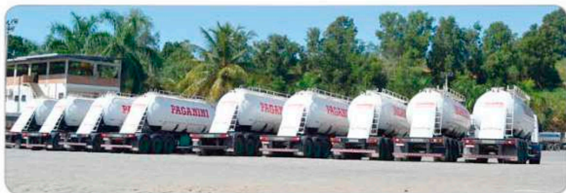
» A situação é preocupante, as empresas estão estacionando as carretas sem data para ligar o motor