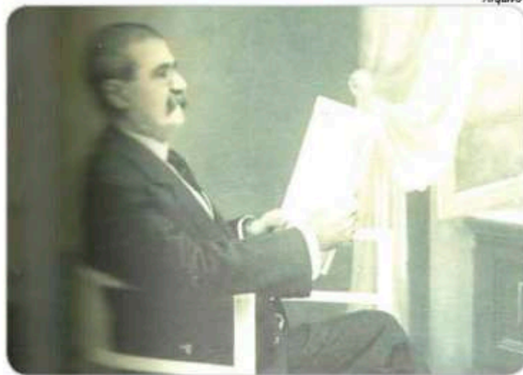
O coronel acabou se tornando o mandatário do município de Iconha