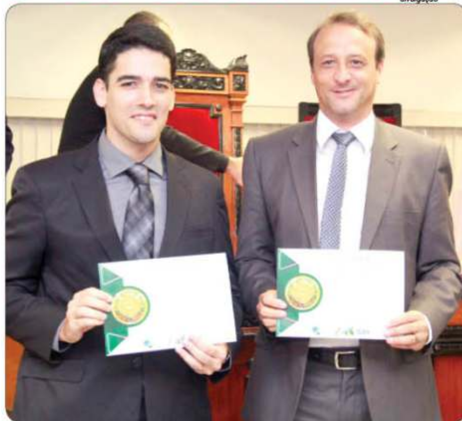
Diplomados prefeito, vice-prefeito e vereadores eleitos em Cachoeiro

O segredo para o bom ator é aprender com os erros que outros cometeram antes dele, para, aí sim, aproveitar o máximo da glória. Mas antes da estreia, ninguém consegue ser estrela. E uma vez astro, é preciso preocupar-se com o próprio brilho, deixando de lado quem já saiu de cena.