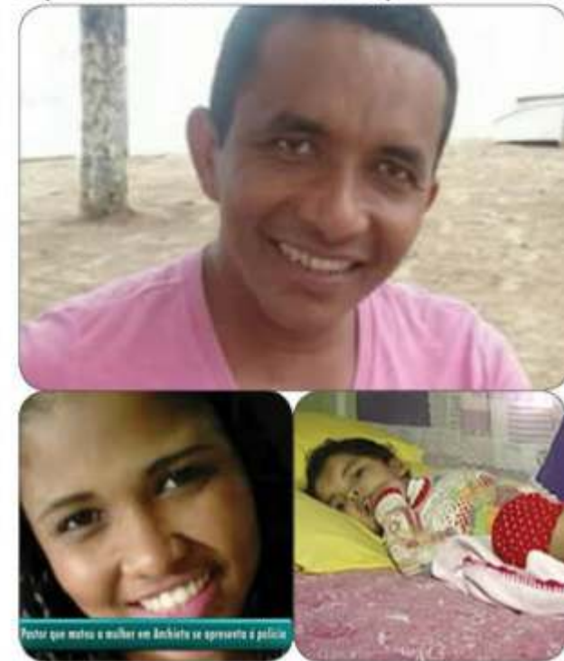
Pastor que matou a mulher em Anchieta se apresenta à polícia

Na época do crime, o acusado contou que agiu por ciúmes, durante uma discussão do casal. Depois do assassinato e da agressão, Pontes fugiu para o norte do Rio de Janeiro, mas acabou sendo preso.