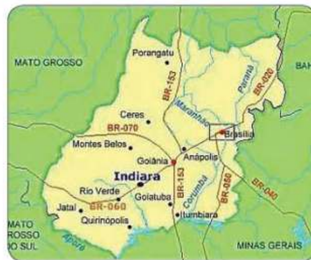
A ex-noiva encontra-se em Goiânia pelo mostra a página do Facebook dela