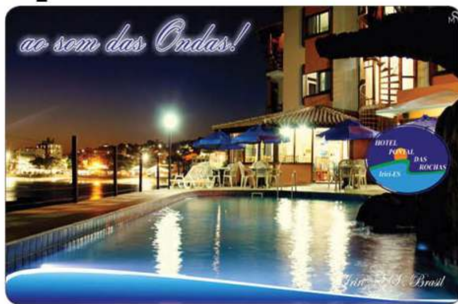
Os hotéis em Iriri estão com 100% de lotação para o réveillon