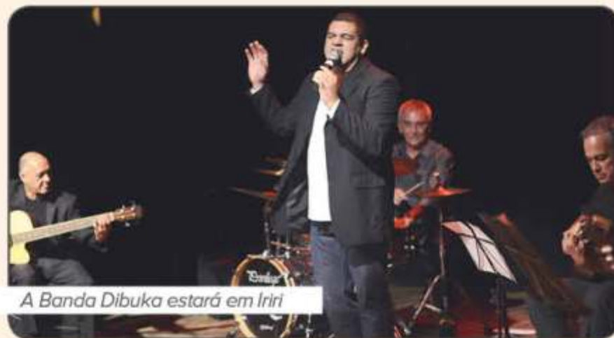
A Banda Dibuka estará em Iriri

Paralelo à queima de fogos, às 21h00, na Praia da Costa Azul, terá a Tenda Eletrônica para animar os turistas que estiverem no balneário. Às 23h00, a Banda Cachoeirense Dibutuka promete tocar o melhor do pop Rock, além das casas noturnas que também oferecem música ao vivo.